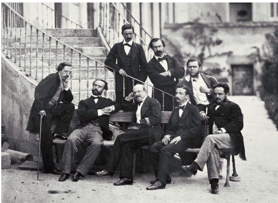
Los miembros de la Comisión.