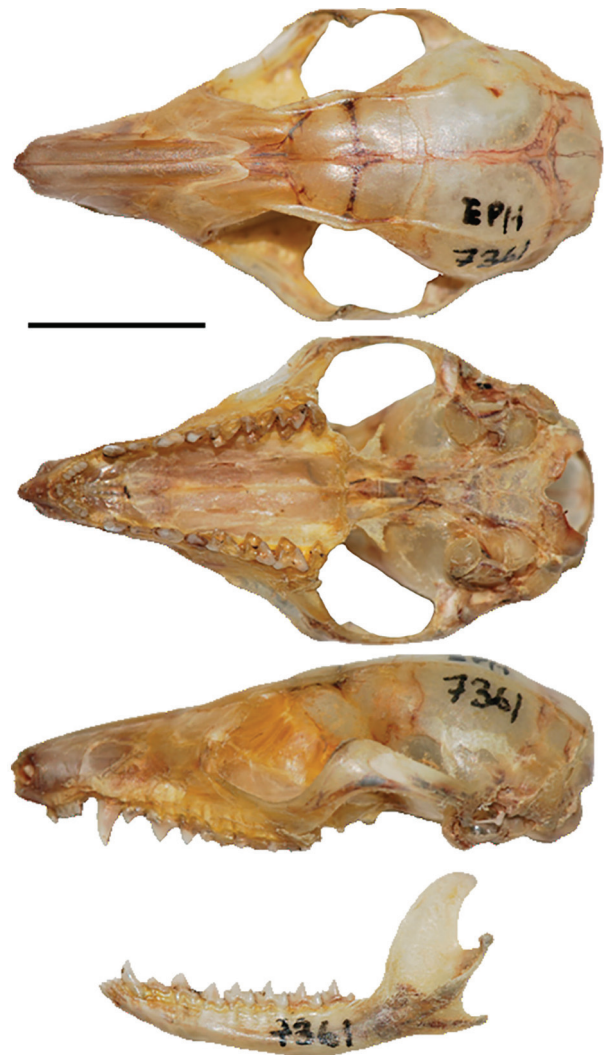
Fig. 2.— Vistas dorsal (arriba), ventral (medio), y lateral (abajo) del cráneo de Marmosa lepida (MEPN 12313), proveniente de la cordillera de Kutukú, suroriente de Ecuador. Barra=10 mm.

El ejemplar presenta un tamaño pequeño de aspecto delicado, con pelaje dorsal rojizo; pelaje ventral rosa, con tonalidad blanquecina en la región abdominal y tono rojizo en la zona de la garganta; una máscara facial oscura rodea los ojos. La pata anterior se caracteriza por ser corta y ancha; presenta cinco dedos con garras pequeñas y puntiagudas (Fig. 3A). Mechones de pelos cortos están presentes en la base de las garras, se extienden hasta la parte medial de las garras. En la superficie